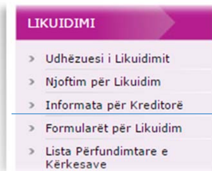
Foto 2 Linku për tu informuar ne lidhje me statusin